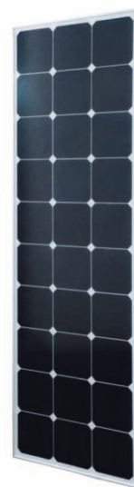
Sun Peak SPR 110_Small