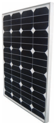
Sun Peak SPR 80