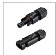
Standard4 connectors / Standard4 Verbinder