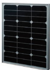
Sun Peak SPR 40